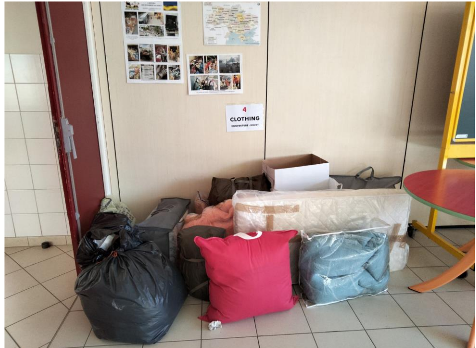
COLLECTE DU COLLEGE HASTINGS ET DE LA MAIRIE DE ROTS