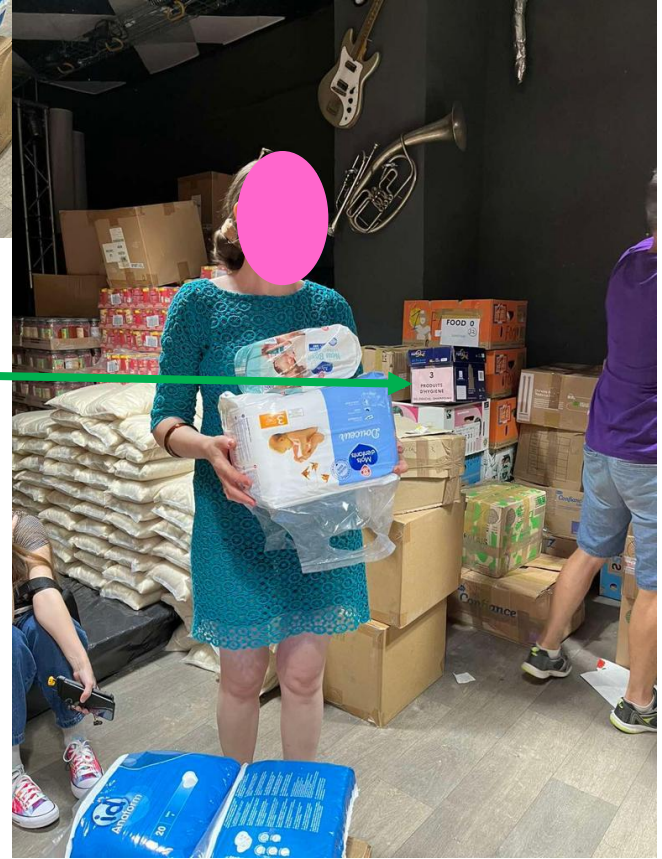
CARTONS DU COLLEGE Dans les entrepôts en Ukraine avant d'être dispatcher