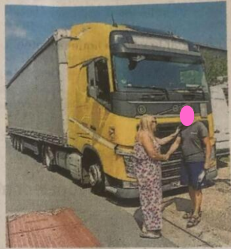
Deux semi-remorques de dons pour les Enfants de l'Ukraine ont pu être stockés dans l'ancien local du bureau de poste de la commune.